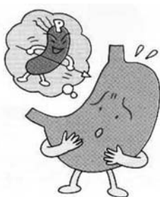
胃がんの原因となるピロリ菌

福祉保健課長 胃がん検診の対象者は40歳以上の方で、町の検診以外に検診の機会のない方となっております。平成23年度の対象者は9千343人、受診者数1千11人、受診率10・7%でした。