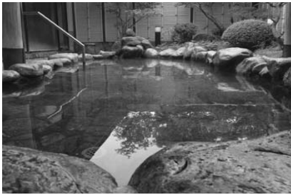
復活した憩遊館の天然温泉

憩遊館源泉湯設備の落雷による損害復旧工事及び落雷損害共済金で、歳入歳出それぞれ759万7千円を追加し、予算総額を68億5千859万7千円とするものです。