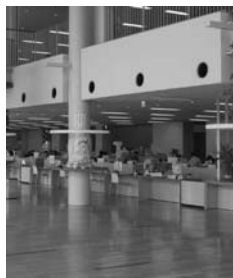
最小限の経費で 最大限の効果を

町長 行政サービスの試算につきましては、今後の行政運営におけるサービスの提供にあたり、常に費用対効果を意識しながら厳しい財政状況の中、最少の経費で最大の行政サービス効果をあげるためにも必要不可欠であると考えております。各種の業務や事業において、一人ひとりがコスト意識を持ち、業務を繰り返すだけでなく想定した費用対効果を業務実施後にチェックし、当初期待した効果が表れたかどうかといった事後評価を行うことが、今後の業務見直しに対する重要な要素であると考えております。