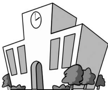
生徒数に応じた校舎建設を

町長 贅沢ではなくコンパクトで使いやすい施設ということで、当初約6千400㎡で計画しておりましたが、約5千900㎡で設計委託しております。