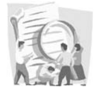
予算の使い道を点検

本定例会では、平成23年度一般会計及び国民健康保険など6つの特別会計と水道事業会計の歳入歳出決算について、総務・教育民生・産業建設の各常任委員会に付託し、慎重に審議した結果、すべての決算について原案のとおり認定しました。