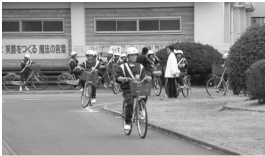
自転車運転の講習を受ける中学生

学校教育課長 各中学校共に、入学直後に自転車通学上のきまりとして、①左側を一列で進行し無理な追越しはしない。②蛇行運転や二人乗り、信号無視等はしないで正しい乗り方をする。③必ずヘルメットと反射タスキを着用し、顎ひもをきちんと締め、④見通しの悪い曲がり角や交差点では、必ず一時停止して安全の確認をする。⑤夕暮れや夜間では必ずライトを付ける。以上の5点を指導徹底しております。また、年度始めに交通安全教室を下妻警察署、交通安全協会、交通安全母の会、町消防交通係の方々のご協力の下に開催し、