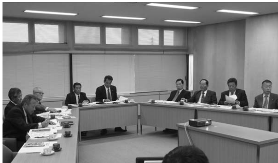
常陸太田市での研修

最後に、福島県内はもとより、県内外においても、大震災の爪跡は今なお色濃く、復興にはさらに時間がかかるものと感じました。今後においても、風化させることなく支援をしていくことが必要であると考えております。