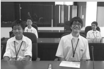
議場見学する一中の皆さん