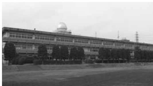
平成25年度から改築予定の八千代一中

だ不透明であり、現時点では大枠の情報の中での編成作業となります。今後、各課の予算要求に対するヒアリングを経て予算を固めていきます。また、八千代第一中学校校舎改築事業ですが、まだ、実施計画があがっておらず、予算総額等は明確ではありませんが、試算では10億を超える建設費となっており、来年度は多額の費用が予想され、予算総額は本年度予算を上回るものと見込んでいます。