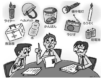
定期的な防災会議の開催を

6月議会で質問した際、町内の建設業者2社及び2店舗と災害時応援協定書を締結しているということでしたが、その後の災害時応援協定についての進捗状況と、他自治体や関係機関との推進については検討するとの回答でしたがどのような検討をしたのか伺います。