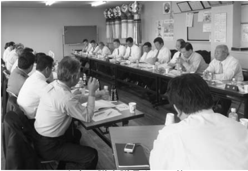
今金町議会議員との研修

3日目に訪問した、えこりん村は生ゴミなどの有機肥料へのリサイクル、二酸化炭素の排出を抑える技術の開発など、環境への負荷を軽減させるエコロジーへの取組を行っております。今回の研修成果を、今後の議会活動や町づくりの参考にしていきます。