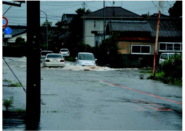
貝谷十字路口付近の冠水現場（10日午前7時30分頃）

町内の被害は死亡や行方不明などの被害はなかったものの、建物の床上、床下浸水などがあり、道路も多くの箇所が冠水し、町内の小中学校も臨時休校となりました。