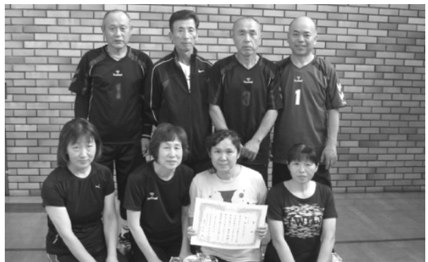
ミックスの部で優勝したトップタイガーの皆さん