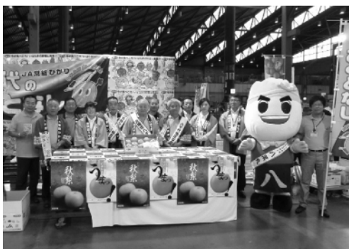
PRを行った協議会の皆さん