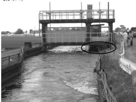
大道泉（江連用水と吉田用水の分水工、○部分が吉田用水）