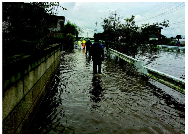
粕礼地内の冠水現場、ガードレールの右側が山川（10日午後2時20分頃）