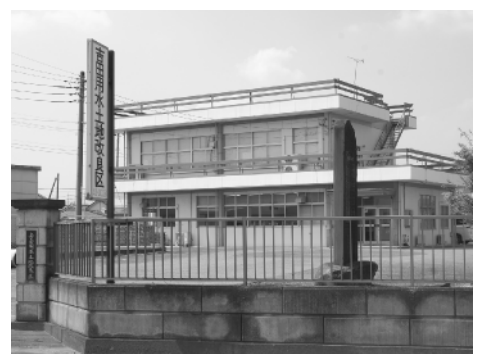
吉田用土地改良区事務所

加いただきました。今年は、町歴史民俗資料館で企画展「吉田用水のあゆみ 苦闘の300年」を開催します。これまで残された貴重な文化遺産としての資料や多くの方々のご指導のおかげで数多くの歴史的事例に接することができました。