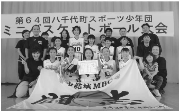
高学年の部で優勝した中結城MBCの皆さん