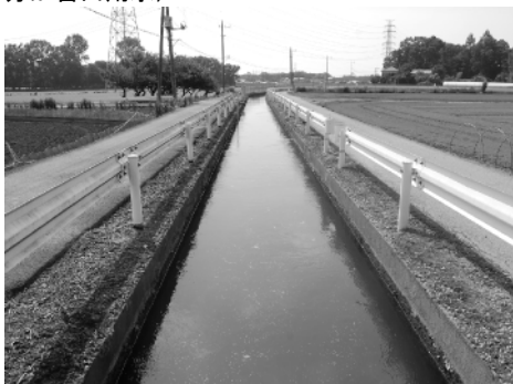
吉田用水路（根ノ谷地先）