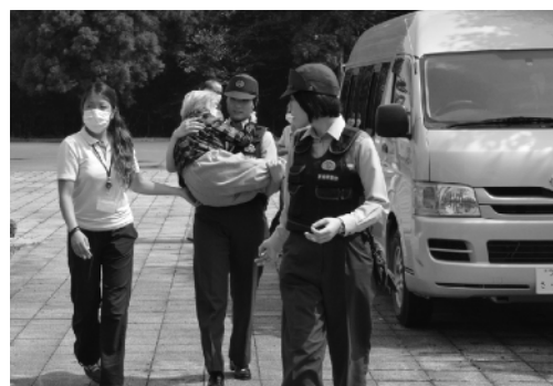
移動困難者役を抱きかかえる警察官

訓練は大地震が発生し、施設倒壊の恐れがあるとの想定で行われ、18名の施設利用者が参加しました。移動困難者役の利用者を女性警察官が抱きかかえるなどしながら警察官、施設職員が連携し、迅速かつ適切な避難誘導が行われました。