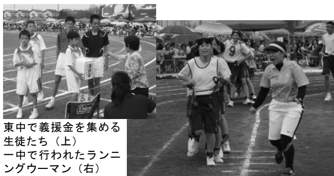
東中で義援金を集める生徒たち(上) 一中で行われたランニングウーマン(右)