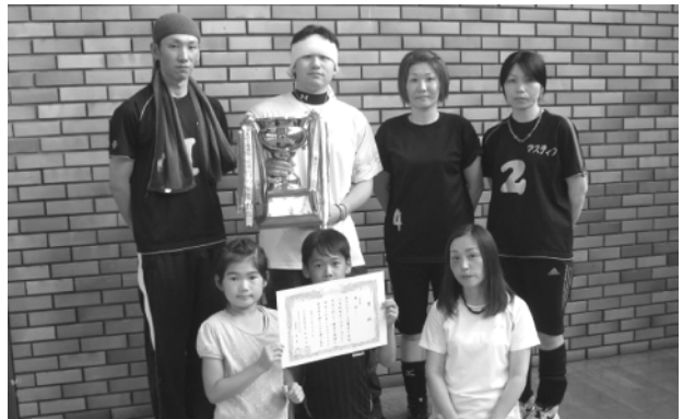
一般の部で優勝した瀬戸井なでしこの皆さん