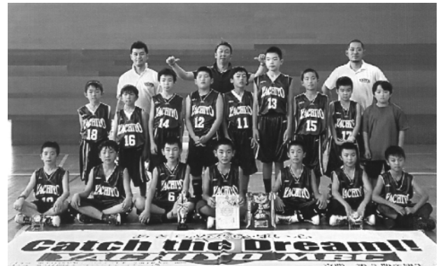
優勝した八千代MBCの皆さん