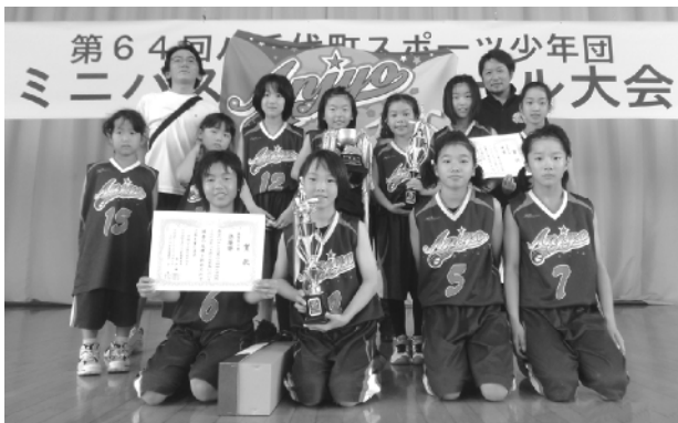
低学年の部で優勝した安静MBCの皆さん