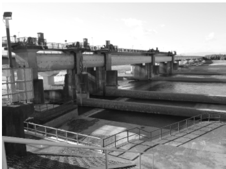
勝瓜頭首工（鬼怒川から江連、吉田両用水の取入口）