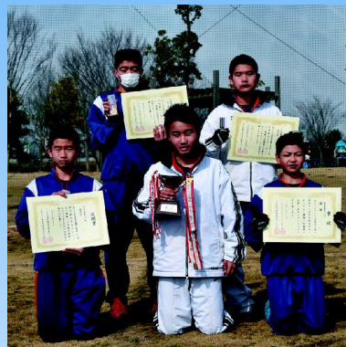
中学男子の部 一中男子陸上部B