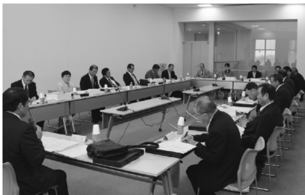
総会で議案を審議する農業委員

A 農地転用の許可を受けずに転用することは農地法違反であり、3年以下の懲役または300万円（法人は1億円）以下の罰金が適用されることがありますので十分ご注意ください。