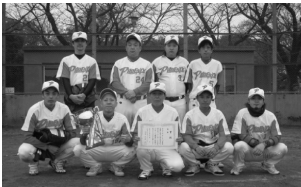
優勝したフェニックスの皆さん