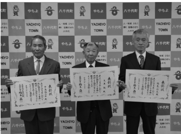
統計功勞者で表彰を受けた統計調査員の皆さん

こられたのは家族や地域の皆さんの協力のおかげです。こんな賞をもらい大変ありがたいです」と受賞の喜びを話していました。 このほか第66回茨城県統計グラフコンクールの表彰式も行われ、町内の小中学生9人が表彰されました。入賞者は次のとおりです。