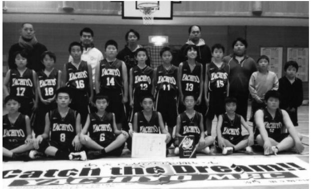
優勝した八千代MBCの皆さん