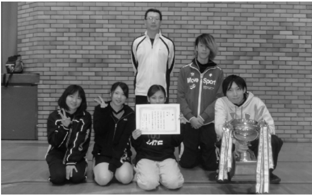
一般の部で優勝したThe secondの皆さん