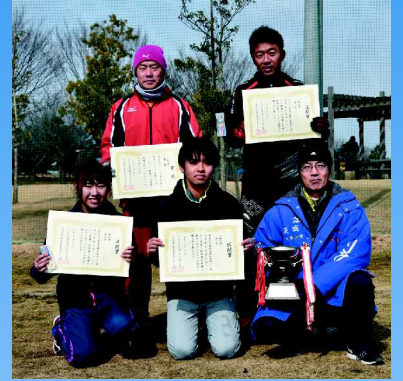
一般の部 八千代ACチームA

2月6日、中結城地区公園で第43回町民駅伝大会が開催されました。大会には一般の部に12チーム、中学生男子の部に16チーム、中学・高校生女子の部に5チームが参加。12kmのコースを5人がタスキをつなぎました。