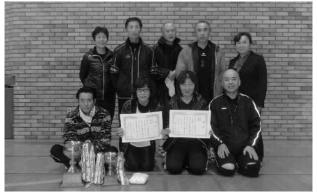
ミックスの部で優勝したT&Cの皆さん