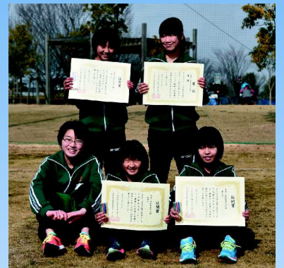
中高女子の部 東中バドミントンE