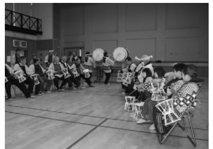
お囃子を楽しむ参加者の皆さん

交流会では、保存会の皆さんがお囃子を披露したほか、子どもたちも一緒に鼓をたたいて楽しいひと時を過ごしました。