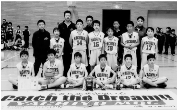
優勝した八千代MBCの皆さん

〔とき〕1月16日(土) 17日(日) 〔ところ〕桜川市岩瀬体育館ラスカほか 〔主催〕桜川市スポーツ少年団 〔主な結果〕 優勝 八千代MBC