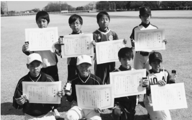
男子の部で区間賞をとった皆さん