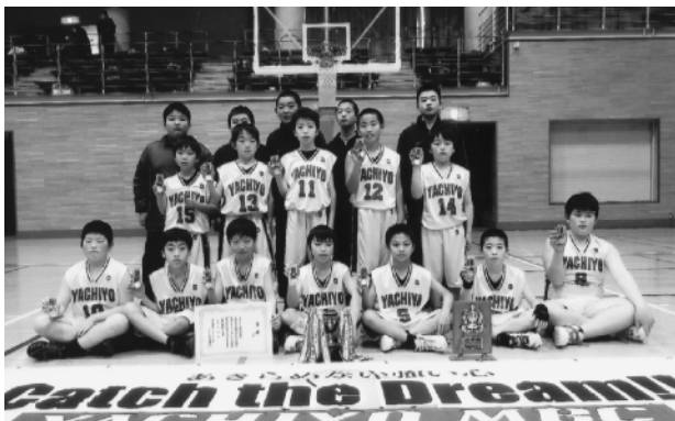
優勝した八千代MBCの皆さん

〔とき〕1月31日(日) 2月6日(土) 7日(日) 〔ところ〕桜川市岩瀬体育館ラスカほか 〔主催〕茨城県県西地区ミニバスケットボール連盟 〔主な結果〕 優勝 八千代MBC