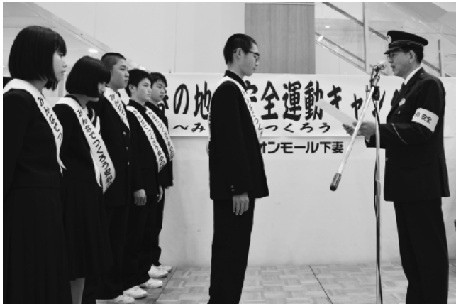
指定書を受け取る八千代一中の生徒の皆さん