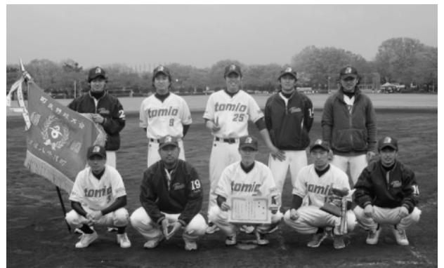
優勝したとみおの皆さん