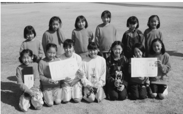
大縄跳びで優勝した下結城MBC-Aの皆さん

■第19回国際ロータリー第2820地区第4分区ロータリークラブ旗争奪古河・花桃まつり学童野球大会