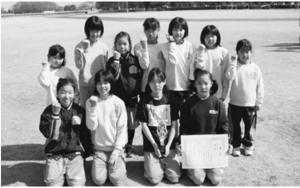
女子の部で優勝した安静MBCの皆さん