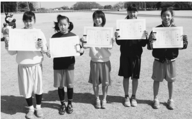
女子の部で区間賞をとった皆さん