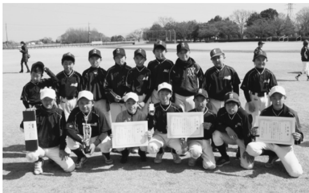
男子の部で優勝した中結城スポーツ少年団の皆さん