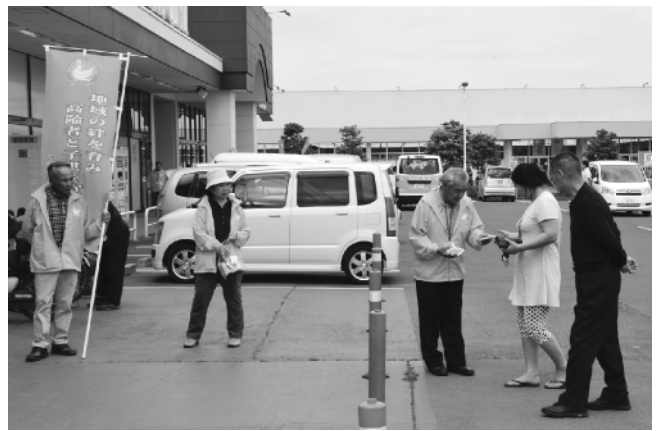
PR活動を行う民生委員児童委員の皆さん

八千代町では、現在50人が厚生労働大臣から委嘱を受け、身近な相談相手として住民に寄り添いながら地域福祉課題の解決にむけて活動しています。