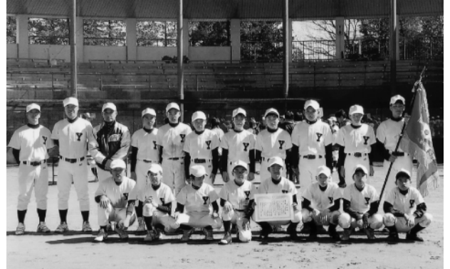
優勝した八千代クラブの皆さん