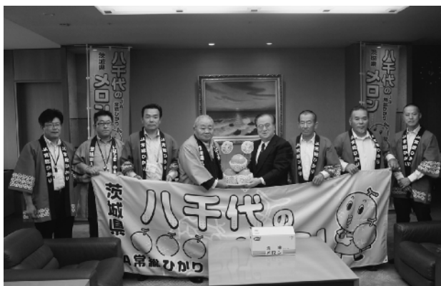
県知事にPRに訪れた関係者の皆さん