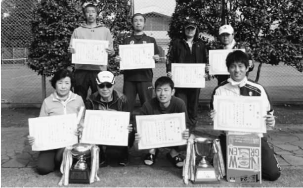
テニス大会で入賞した皆さん