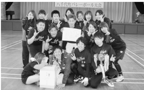
町民の部で優勝したらぶゆーの皆さん