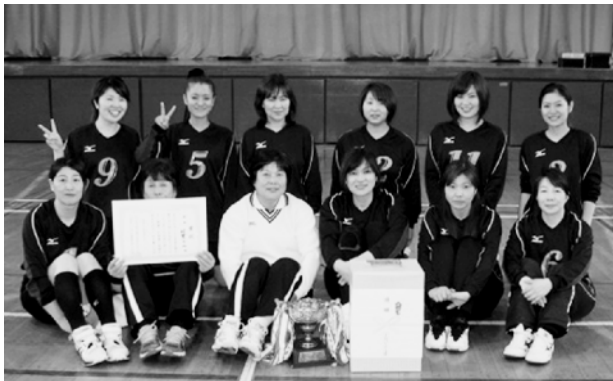
ママさんの部で優勝した村貫の皆さん