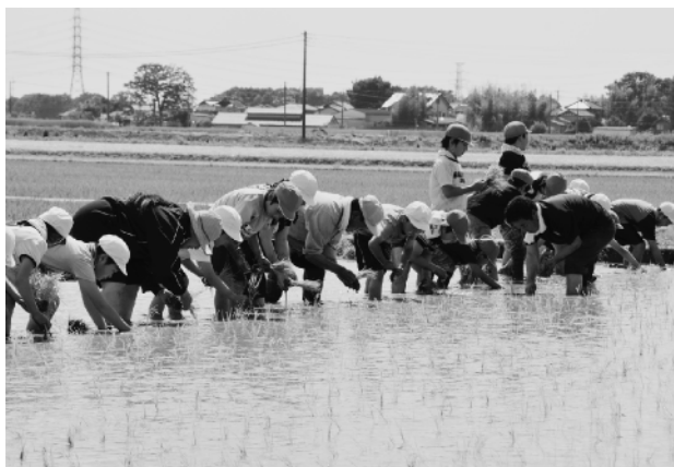
田植えをする西小の児童の皆さん