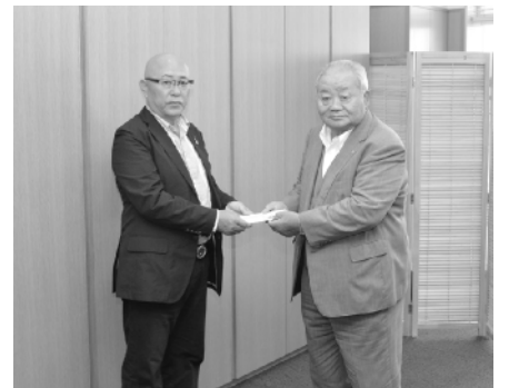
大久保町長に募金を手渡す伊佐会長 (左)