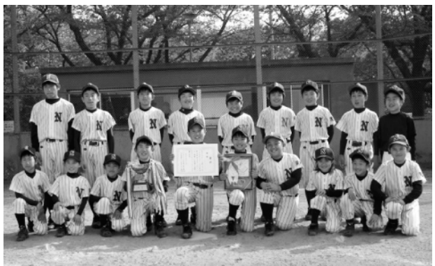
優勝した中結城スポーツ少年団の皆さん