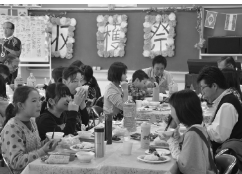
収穫したお米を味わう皆さん