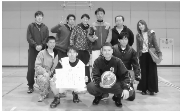
優勝したエンペラーの皆さん