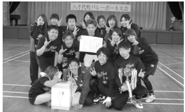
町民の部で優勝したらぶゆーの皆さん