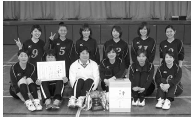
ママさんの部で優勝した村貫の皆さん