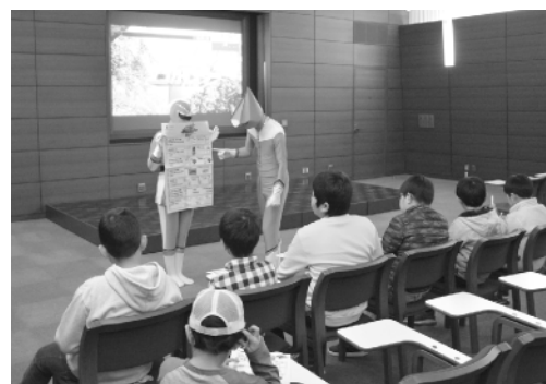
エコガンダーからのクイズを楽しむ子どもたち

12月4日、町立図書館で2016クリスマスサイエンスが開かれました。会場には、電気実験コーナーや工作コーナーが設けられ、児童たちは電子レンジを使ってのキーホルダー作りやクリスマスリース作りなどを体験しました。また、環境ゲームコーナーも設けられ、エコガンダーから出されるクイズを楽しみながら身近でできるエコ活動を学んでいました。