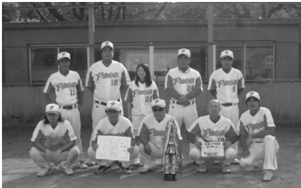
優勝したフェニックスの皆さん