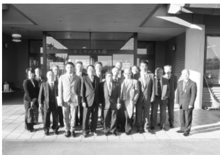
那珂川町議会議員の皆さんと

今回の研修成果を、今後の議会運営、議会だより作成及び議会広報活動に十分活かし、町民の皆様のご信頼に応えてまいります。