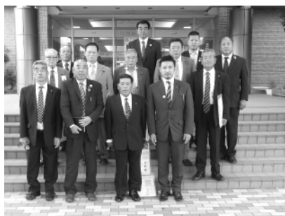
津幡町庁舎前にて

今後、安心して子供を産み育てることのできる魅力あるまちづくりを進めるうえで、今回の研修成果を反映させていきます。