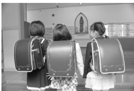
安心して入学できるように

今後については、先進地での事例を参考にし、前倒し支給に関して更に研究してまいります。