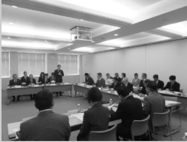
境町での研修の様子

その後、11月18日の委員会において、原案は5部体制になっているが、秘書公室を他の部署に編成させ4部体制にするべきとの意見や原案の産業建設部に含まれている生活衛生・環境保全に関するところは、総務部所管の方が適しているとの意見、施行期日を「平成29年1月1日」から「平成29年4月1日」に改める意見が出され、それぞれについて質疑の後、採決を行ったところ、条例第1条から第4条については、原案のとおり賛成多数で可決、附則の施行期日については、「平成29年4月1日」に修正することに賛成多数で可決いたしました。