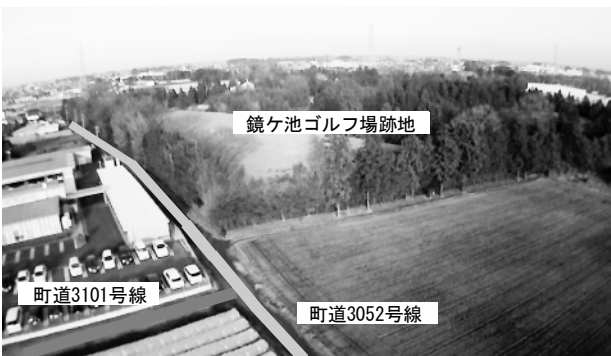
地域に配慮した土地開発を

今後も引き続き、古河市と連携を密にし、情報収集に努め、用地交渉の早期解決を図り事業の再開に向けて要望してまいりたいと考えております。