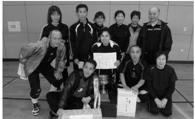
ミックスの部で入賞した皆さん