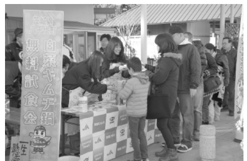
白菜キムチ鍋を配る流対協の皆さん

試食した来場者は「とてもおいしいです。やっぱり鍋には白菜ですね」と話していました。