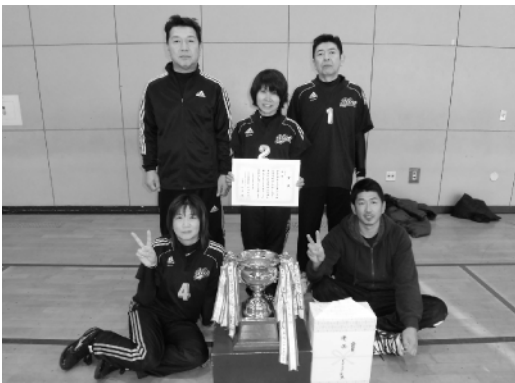
一般の部で優勝したミントの皆さん