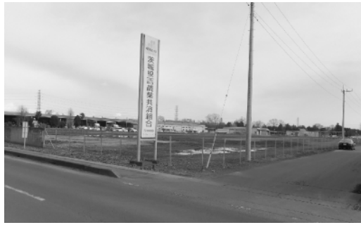
現在の茨城県西農業共済組合西側の町有地

◇一般会計補正予算(第3号) 茨城県西農業共済組合西側の町有地にある残土を鏡ヶ池ゴルフ場跡地へ搬出するための経費として、1千599万5千円増額するものです。