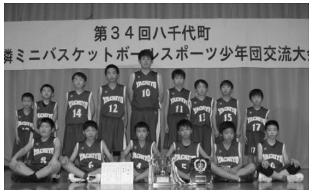
男子の部で優勝した八千代MBCの皆さん