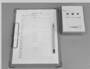
受付簿に住所と氏名を記入し傍聴券を取り入場してください

より多くの町民の皆さんに、議会を身近に感じていただくために、議会傍聴や施設見学を受け付けております。各種団体や学校の社会科見学などにお取り入れください。次の定例会は3月に行います。詳しい日程は2月下旬に議会ホームページ等でお知らせいたします。