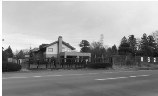
今後、開発が期待される鏡ヶ池ゴルフ場跡地

◇公有財産(土地)の取得 鏡ヶ池ゴルフ場跡地8万7千964㎡を3億6千100万円で購入するものです。