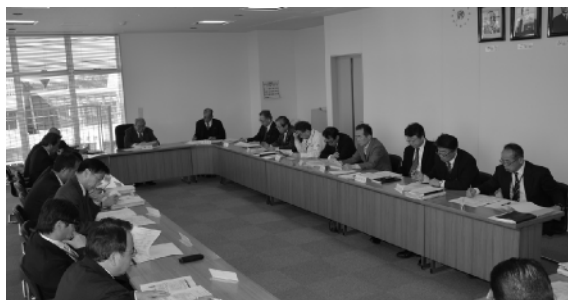
より良い組織改革を

町長 茨城県におきましては、平成17年10月に「市町村との人事交流方針」が制定されています。その方針にお