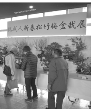
多くの人が訪れた盆栽展

1月7日から14日まで、中央公民館エントランスホールに「祝成人新春松竹梅盆栽展」コーナーが設けられました。この催しは、町盆栽クラブの会員などが参加し、町の成人式「はたちのつどい」にあわせて毎年行われています。