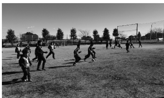
頑張っている子どもたちのために