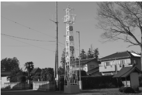
改修された佐野西の火の見櫓