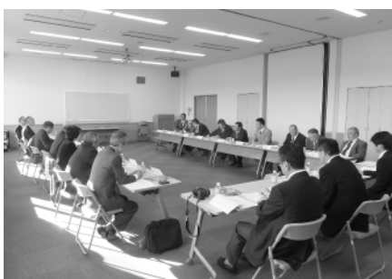
那珂川町での研修