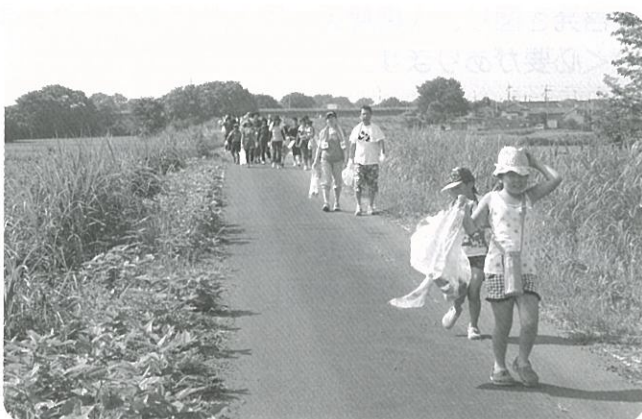
鬼怒川クリーン作戦