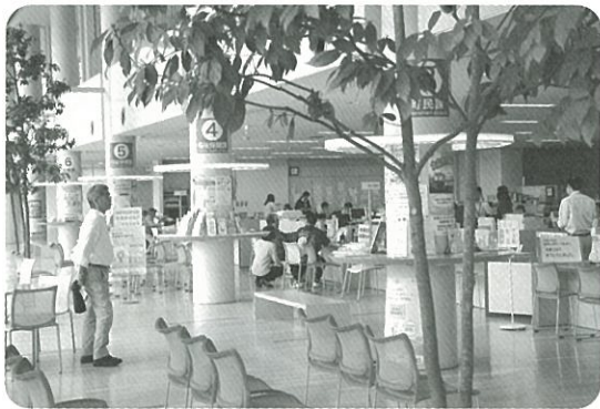
町民ホール（庁舎1階）