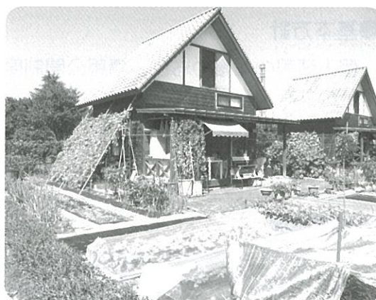
クラインガルテン八千代