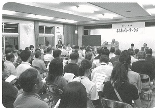
ふれあいミーティング