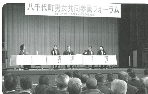
男女共同参画フォーラム