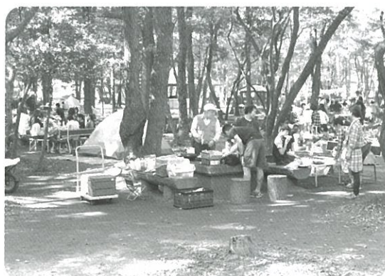
グリーンビレッジ キャンプ場