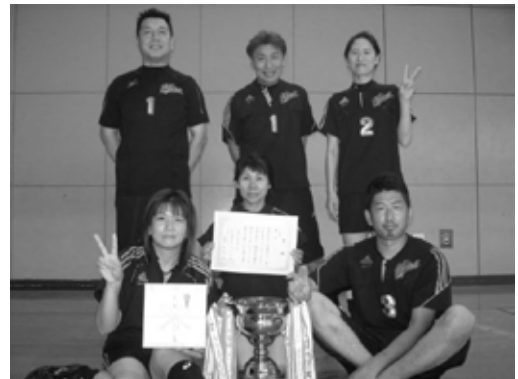
一般の部で優勝したミントの皆さん