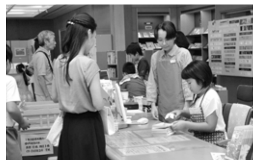
図書の貸し出し業務を行う参加者

体験を終えた児童たちは「細かい作業は難しかったけどカウンター業務は楽しくできました。来年も参加したいです」と話していました。