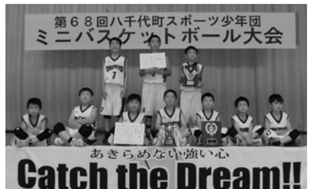
低学年の部で優勝した八千代 MBC の皆さん