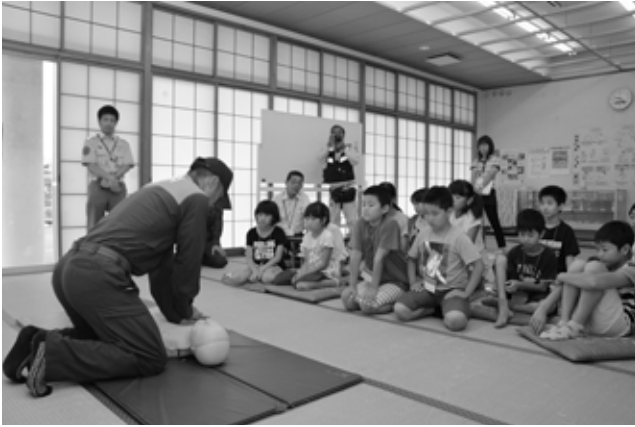
消防署員から心肺蘇生の説明を聞く参加者の皆さん