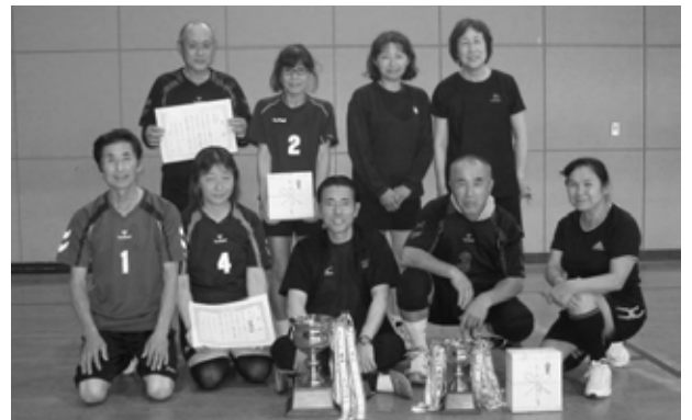
ミックスの部で優勝したT&Cの皆さん