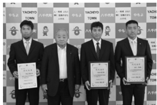
大久保町長に認定の報告に訪れた皆さん

農業経営士と青年農業士は農業の担い手の育成や地域農業の活性化のため、県知事が定めています。町内では農業経営士が7人、青年農業士が8人認定されています。