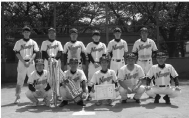
優勝した根ノ谷ソフトボールの皆さん

優 勝 安静 MBC 準優勝 八千代 MBC 第3位 下結城 MBC 低学年の部 優 勝 八千代 MBC 準優勝 下結城 MBC 第3位 西豊田 MBC