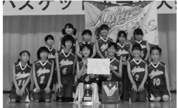
高学年の部で優勝した安静 MBC の皆さん

優 勝 安静 MBC 準優勝 八千代 MBC 第3位 下結城 MBC 低学年の部 優 勝 八千代 MBC 準優勝 下結城 MBC 第3位 西豊田 MBC