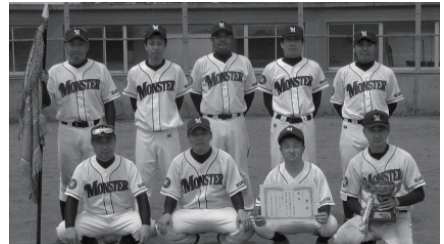
優勝したモンスターの皆さん

〔主な結果〕 Aブロック 優 勝 モンスター 準優勝 とみお Bブロック 優 勝 高野ブラザーズ 準優勝 八千代町役場