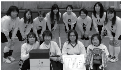
優勝した平塚の皆さん

〔と き〕 4月14日(日) 〔と ころ〕 八千代町総合体育館 〔主 催〕 八千代町体育協会 〔主な結果〕 ママさんの部 優 勝 平塚 準優勝 仁江戸