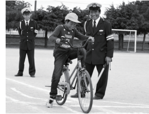
安全な乗り方の指導を受ける児童

4月15日から5月30日にかけて、町内5校の小学校と2校の中学校で交通安全教室が開催されました。5月20日には、安静小学校で行われ、交通安全協会や交通安全母の会、下妻警察署などの指導のもと、1・2年生は正しい道路の歩き方を、3～6年生は正しい自転車の走行の仕方を学びました。