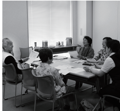
協議体「みらい八千代」の様子

これまで、高齢者の方の生活支援については、介護保険等の公的サービスで行ってきました。しかし、ひとり暮らしの高齢者や高齢者のみの世帯が増え、さらに高齢者の生活スタイルや価値観も多様化しており、一律の公的サービスだけでは対応しきれない状況になっています。そこで、「生活のちょっとした困りごと」を地域で助け合って解決していくことが必要であり、これを生活支援体制整備事業といいます。