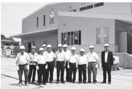
建設中の給食センター前にて

6月6日、議員の提案により、現在建設中の給食センターの現地視察を行いました。 最初に、設計を担当し、工事監理を行っている株式会社フケタ設計と、建設工事の請負者である鈴縫・高塚共同企業体の担当者から工事の進捗状況、調理等に使用する設備の配置、給食の材料運搬から調理、配送までの流れなどについての説明を受け、その後、建設工事中の施設内を見学しました。見学中も各所で説明を受けながら質問をするなど、情報の交換を行いました。