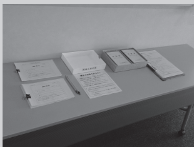
簡単な受付で傍聴することができます

より多くの町民の皆さんに議会を身近に感じていただくため、議会の傍聴や施設見学を受け付けています。各種団体や学校の社会科見学などに取り入れください。 次の定例会は9月に行います。詳しい日程は8月下旬に議会ホームページ等でお知らせいたします。