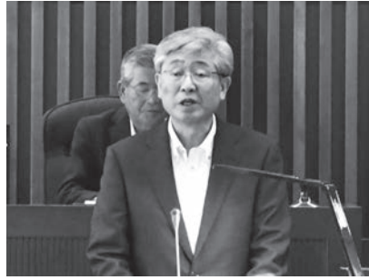
答弁をする古宇田副町長

に進めることであると認識しています。特に、町長が掲げる公約の実現に向けて精一杯取り組んでいきたいと考えています。