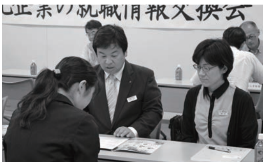
情報交換を行う就職指導担当者と人事担当者

6月21日に役場会議室で、高校の就職指導担当者と企業の人事担当者の就職情報交換会が開かれました。当日は八千代高校を含め6校の就職指導担当者と八千代工業団地進出企業の2社を含め11社の人事担当者に参加し、雇用動向や企業の採用計画などについての情報交換を行いました。