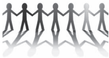
すべての人が住みよい町に