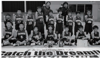
優勝した八千代ミニバスの皆さん

〔と き〕 4月14日(日)・21日(日) 〔と ころ〕 池の川さくらアリーナ 他 〔主 催〕 日立市ミニバスケットボールスポーツ少年団連絡協議会 〔主な結果〕 男子の部 優勝 八千代ミニバスケットボールスポーツ少年団