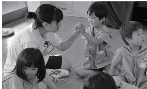
園児と遊びを通して関わる生徒

7月5日、八千代高校の福祉・家庭系列の3年生19人が、子どもの発達と保育の授業の一環で、さわきこども園で実習を行いました。読み聞かせや活動を通して、子どもや保育士の動きを学んだ生徒は「保育士の行動に、全てに意図があることが分かりました」と感想を語りました。