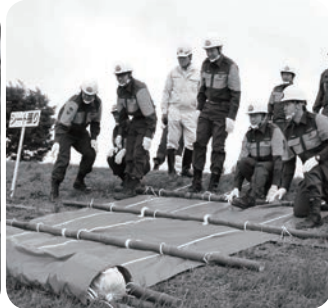
シート張り訓練の様子