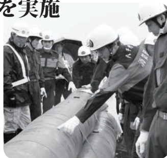
水のう訓練の様子

7月7日、鬼怒・小貝水防連合体（八千代町、つくばみらい市、下妻市、常総市、つくば市）主催による水防訓練が、常総市上三坂地先の鬼怒川左岸で実施され、八千代町消防団から第3分団の10人が訓練に参加しました。雨が降りびしょ濡れになりながらも、堤防の漏水や亀裂箇所の拡大を防ぐ伝統的な水防工法を実施しました。