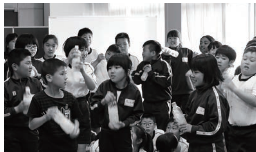
トイレトペーパーの溶け方を実験する児童たち

町内5つの小学校で6月12日～7月5日にかけて町と茨城県流域下水道事務所県西浄化センターの共催による下水道出前講座が行われ、中結城小学校では4年生60人が受講しました。児童たちは、下水道の役割や仕組みなどを学び、日常生活で欠かせない働きをしていることを学びました。