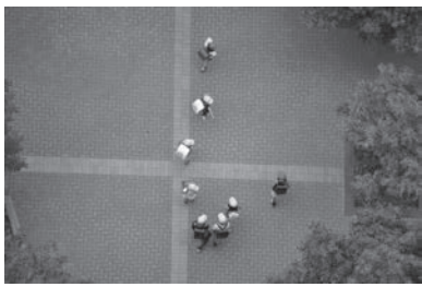
子どもたちが安全に登下校できるよう

学校で毎年4月から5月の間に交通安全教室を実施しており、実体験を通して交通安全や交通ルールを学ぶ機会を設け、また、学級指導や道徳の授業、全校集会を通して「命の大切さ」や「自分の命は自分で守る」という意識を育てる教育も実施しています。また、教育委員会では、警察や常総工事事務所、町の交通担当、道路担当と一緒に通学路の危険箇所の合同点検を毎年実施しており、登下校時の安全な環境整備に努めています。また、交通事故防止と不審者などの対策として、登下校時に教職員が立哨指導を行うほか、関係機関との連携として保護者によるパトロールや警察にもパトロールを依頼しています。