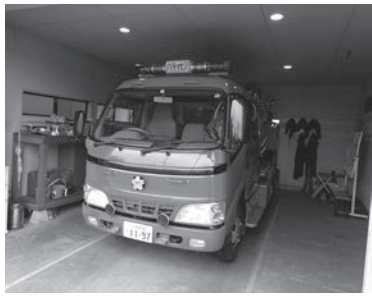
更新される消防ポンプ自動車 (写真は現在の車両)