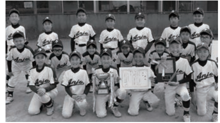
優勝した安静ファイターズの皆さん

優勝 安静ファイターズ 準優勝 中結城スポーツ少年団 第3位 西豊田スポーツ少年団