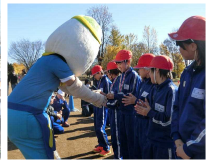
<校内持久走大会 結果一覧> *1~3位まで