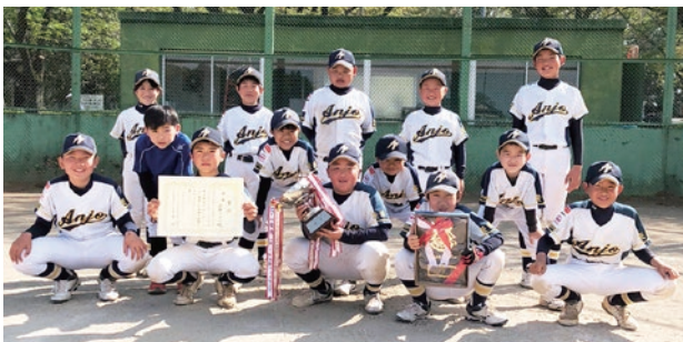
優勝した安静ファイターズの皆さん

■第43回八千代町スポーツ少年団軟式野球大会 〔とき〕4月11日(日) 〔ところ〕八千代町民公園 〔主催〕八千代町スポーツ少年団、八千代町軟式野球スポーツ少年団 〔主な結果〕 優勝 安静ファイターズ 準優勝 中結城スポーツ少年団 第3位 西豊田スポーツ少年団