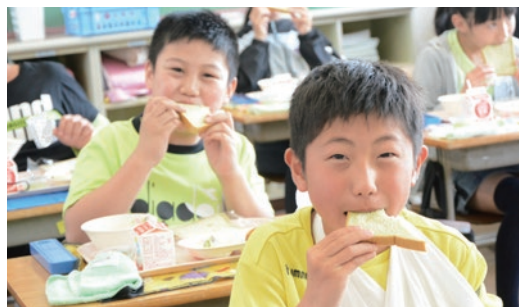
さしま茶を使った食パンを食べる児童

5月6日、町内の小中学校の給食に、八千代町産のさしま茶を使った食パンが提供されました。これは、5月1日が八十八夜であることにちなんで、地産地消の一環としての取り組みです。さしま茶の粉末が練り込まれた香り豊かな食パンを、子どもたちは笑顔で頬張りました。