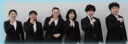
今年度の新規採用職員の皆さん