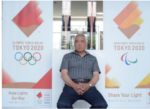
東京 2020 オリンピックの聖火リレートーチと

て気が付いた感じだったな。参加してるとって自覚はなく、後になってあの時走ったのが聖火リレーだったんだって。道路の脇にもたくさん人がいたね。走っている時は、オリンピックの聖火リレーに参加してるとって自覚はなく、後になってあの時走ったのが聖火リレーだったんだって。道路の脇にもたくさん人がいたね。走っている時は、