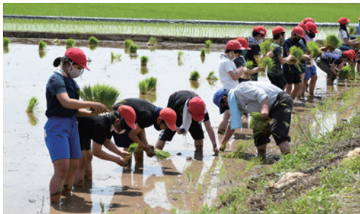
田植えをする児童たち

5月26日、地元農家の協力のもと、西豊田小学校5年生40人が学校近くの水田で田植えを行いました。泥だらけになりながらも田植えを楽しんだ児童たちは、作業を終えて「思ったよりも難しくなかった」「昔の人はこんなに大変な作業をしていたんだと分かった」と笑顔で話しました。