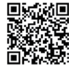
八千代町 洪水ハザードマップ

ハザードマップは、3日間で669mmの雨が降り、鬼怒川が氾濫した場合を想定しています。