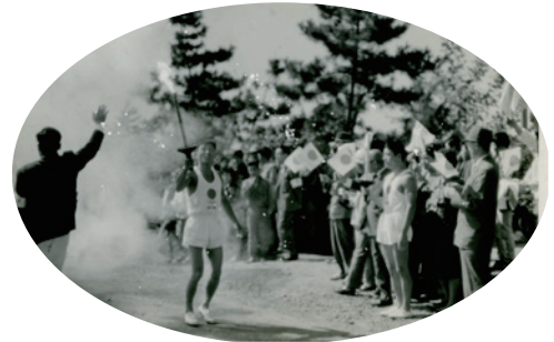
当時の聖火リレーの様子