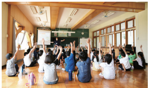
西豊田小学校での下水道出前講座の様子

5月18日から7月5日にかけて町内の4つの小学校で4年生を対象に、町と茨城県流域下水道事務所共催の下水道出前講座が行われています。6月11日に西豊田小学校で開催された講座では、下水道のはたらきについて、クイズや実験をしながら児童たちは積極的に学んでいました。