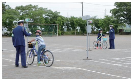
川西小学校での交通安全教室の様子

4月12日から5月26日にかけて、交通安全協会と交通安全母の会、下妻警察署の指導のもと、町内の小中学校7校で交通安全教室が開催されました。5月20日に川西小学校で行われた教室では、1・2年生は道路での歩き方について、3～6年生は道路での自転車の乗り方について学びました。