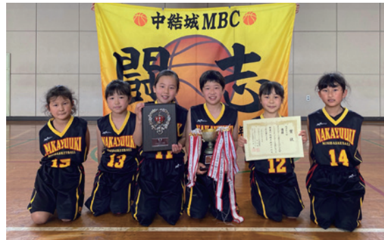
優勝した中結城MBCの皆さん

〔と き〕 5月29日(土)、30日(日) 〔と ころ〕 八千代町総合体育館 〔主 催〕 八千代町スポーツ少年団、八千代町ミニバスケットボールスポーツ少年団 〔主な結果〕 高学年の部 優 勝 八千代ミニバスケットボールスポーツ少年団 準優勝 西豊田MBC 第3位 中結城MBC 低学年の部 優 勝 中結城MBC 準優勝 西豊田MBC 第3位 下結城MBC