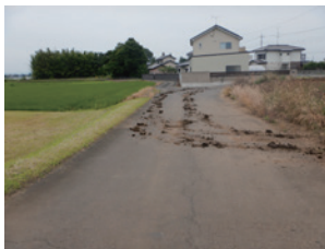
土が残ったままの道路

問い合わせ 産業振興課農業振興係 (内線2230) 都市建設課道路河川管理係 (内線2310)