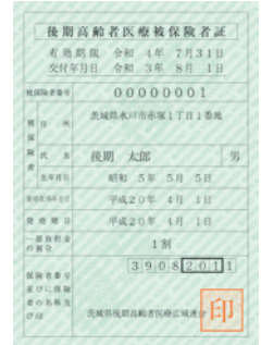
後期高齢者医療被保険者証 （見本）