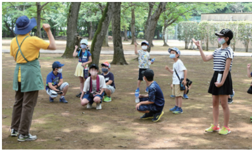
じゃんけんゲームをする参加者

6月13日、令和3年度子ども教室が開校されました。子ども教室は、学校や学年の違う友達と協力しながら、普段はできない体験をするものです。当日は、町民公園でじゃんけんゲームや木に貼られた文字を見つけていく宝探しゲームなどを行い、参加者は楽しい時間を過ごしました。