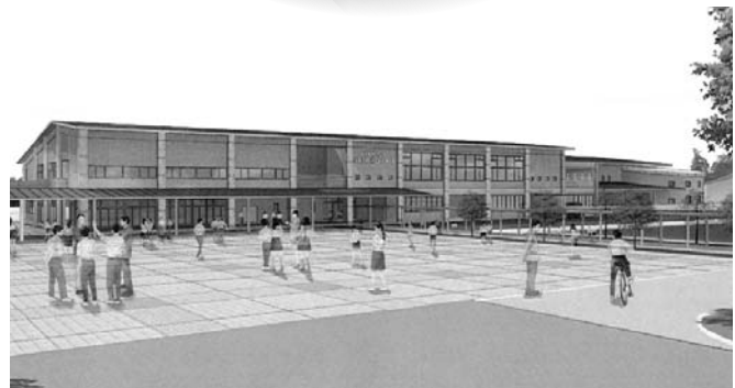
八千代第一中学校校舎完成予想図（北側）