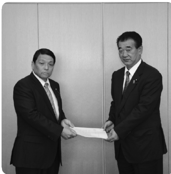
水垣議長へ要望書を提出