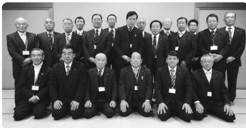
3市町農業委員代表者の皆さん

会議では、各農業委員会の状況報告をはじめ、農業行政やお互いが抱える様々な課題についても熱心に情報交換をしました。皆さん「農業委員活動をするうえで有意義な会議となった」「今後もぜひ続けていきたい」と話していました。