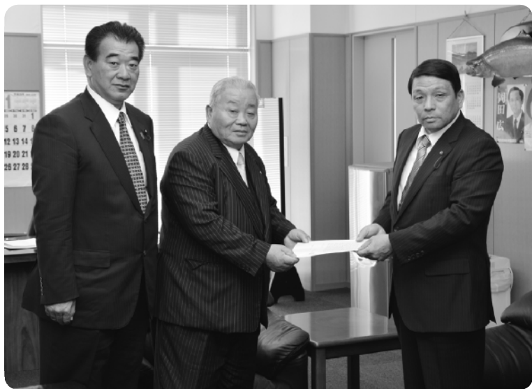
大久保町長へ要望書を提出