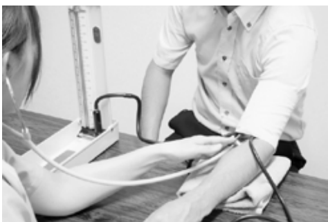
健康診断受診により疾病の早期発見・治療を

です。 また、平成30年度から平成35年度までを計画期間とする第2期データヘルス計画及び第3期八千代町特定健康診査等実施計画を策定中です。この計画にも受診率の向上を目指した施策を盛り込み、住民の健康意識の改革に努めていきたいと考えています。