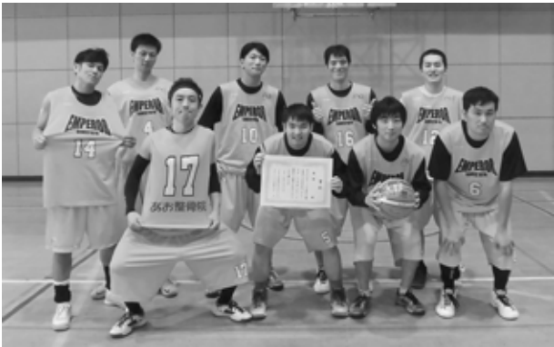
優勝したエンペラーの皆さん