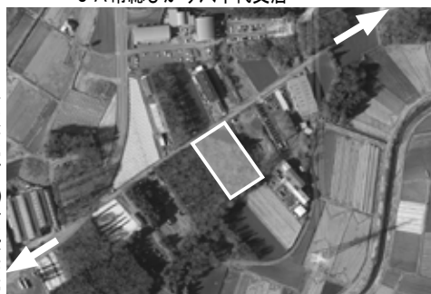
給食センター建設予定地 (写真中央枠線内)