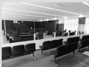
傍聴席から見た議場の様子