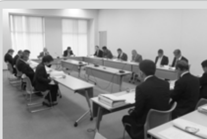
特別委員会の会議の様子

主な質疑と答弁は、「農業委員と農地利用最適化推進委員について、国・県からの指針があるのか。」との質疑に対し、執行部より「国・県の基本方針を参考にし、町独自の考え方の下に定めている。」との答弁がありました。また、「農地利用最適化交付金の期限はあるのか。」の質疑に対しては、「法改正がない限り、継続的に交付されると考えている。」とのことでありました。また、「推進委員の業務に対して、月額報酬1万9千円は高すぎるのではないか。」との質疑に対しては、「農家と農家の間を歩いてもらい、農地の貸し手・借り手への働きかけを行うことや農地・パトロール、耕作放棄地の発生防止・解消など現場活動が中心であり、妥当だと考えている。」との答弁でした。