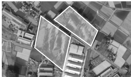
平成30年8月に造成が完了する八千代工業団地

町長 会長や社長などの役員が、大変興味を持たれている企業があります。企業名は、申し上げられませんが、日野自動車関連の製造業であり、現在、詰め交渉を行っているところと見えます。造成工事が来年8月頃に完成する予定であり、一層、企業誘致活動を展開していきたいと思えます。 今後、工業団地の造成工事を円滑に進めながら、企業の誘致活動を行い、雇用の場・財源の確保という当町が抱える課題解決に向け努力したいと考えています。