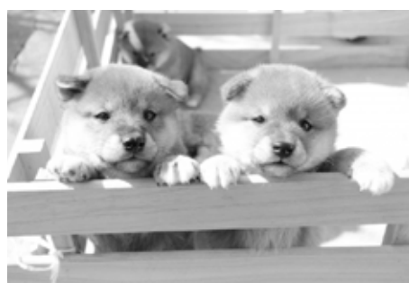
殺処分ゼロを目指して町独自の取組を

て、県の指導のもと連携協力してまいります。したがって、今のところ町独自の条例を制定する予定はありません。