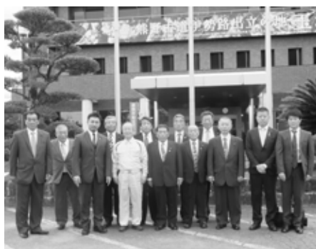
三重県玉城町庁舎前にて

当町においても高齢者をはじめとする交通弱者の移動手段の確保は喫緊の課題であり、現在運行している医療機関巡回バスの運行方法についても検討すべき段階を迎えています。今後、当町の新しい公共交通網の整備を進めるうえで、今回の研修成果を反映させていきます。