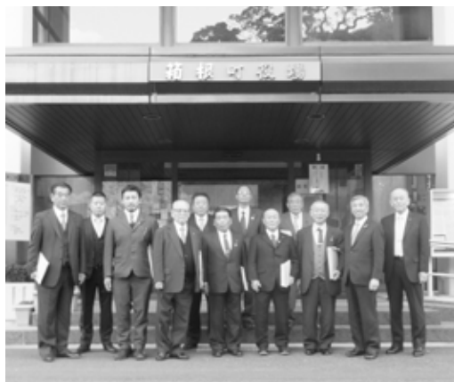
神奈川県箱根町庁舎前にて

今回の研修成果を、今後の議会運営、議会だより作成及び議会広報活動に十分活かし、町民の皆様の信頼に応えてまいりたいと考えています。