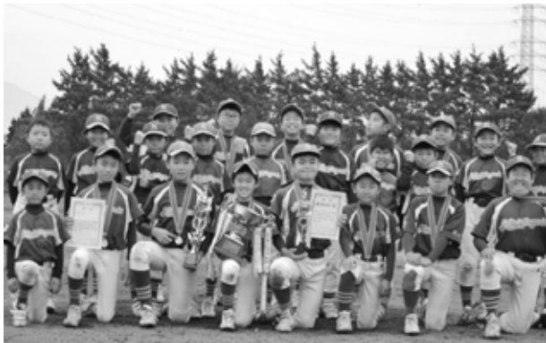
優勝した西豊田スポーツ少年団の皆さん