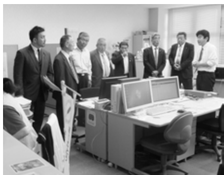
オペレーター室で説明を受ける様子