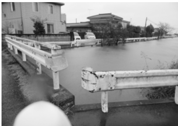
九郎兵衛橋南側と下流を望む (平成 29 年 10 月 台風翌日撮影)

す。当町においても、町内で毎年のように水害被害が発生していますので、町民の方々が安全で安心して生活が送れるよう、河川の管理者である県並びに国の関係機関に対し、河川整備を早期に着手していただくよう引き続き要望してまいります。