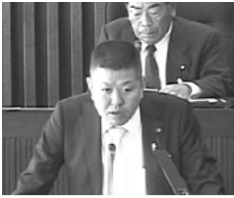
議会改革に全力で取り組むと力強く決意を述べた大里副議長