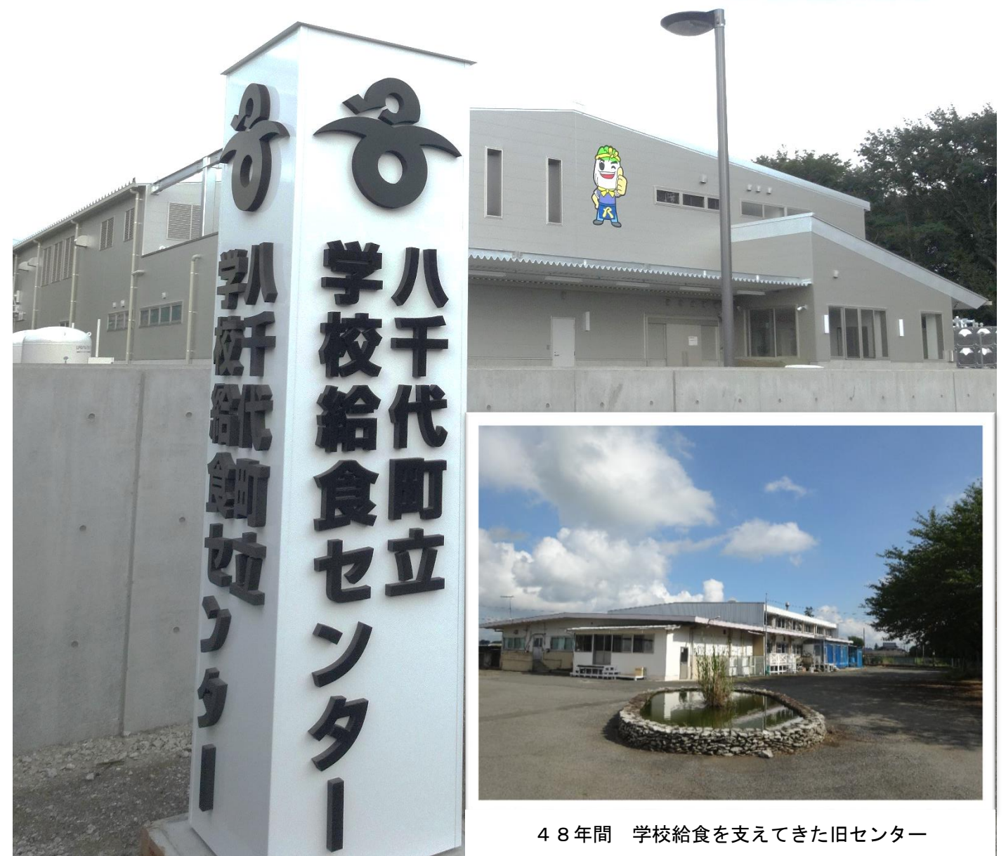
48年間 学校給食を支えてきた旧センター