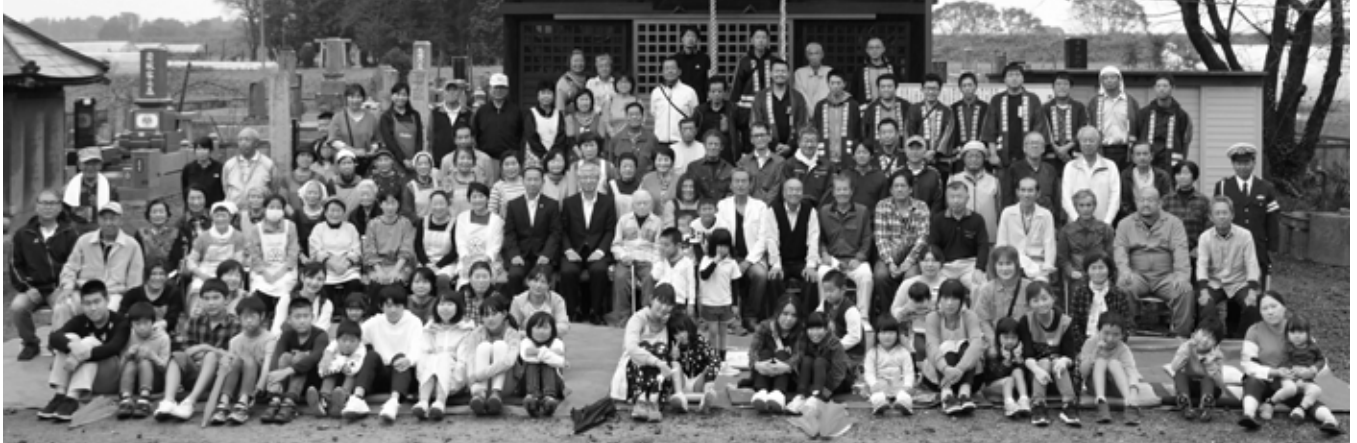
地域住民同士や各世代間同士のコミュニケーション向上の機会を目的に開催された「第1回川尻よつ葉のつどい」に参加した147人の参加者

昨今の自然災害や少子高齢化の中で以前から地域間のコミュニケーションが取れる場が必要だと感じていました。しかし、実際にどのような方法で取る機会を作ればよいのか悩んでいたところ、今年の4月に町の社会福祉協議会で、「三世代交流費助成制度」があることを知り、これだと思い、行政区組合長や代議員、社会教育委員の方々に相談をかけました。そして実行するにあたり、私から3人の方に実行委員を依頼し、その後、川尻行政区内にある、朋の会等10団体以上のすべての代表の方々に集まっていただきました。そこで補助金を使ってイベントをしてもよいかという相談から始め、皆さんの協力をいただきながら、何度も集まりアイデアをまとめ、今回のつどいを開催することができました。本当に、自分の家の事だけでも忙しい中で、それぞれの時間を割いて、地域全体のために動き、関わり、力をいただいたことはとても嬉しく本当に感謝しています。これを機に川尻の住民同士が、より気軽に声をかけ合いやすい関係になってもらえたら幸いです。