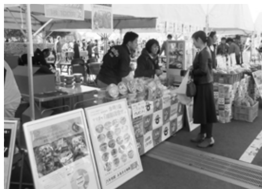
来場者に町をPRする様子

11月10日、日野自動車古河工場で秋まつりが開催されました。八千代町ではPRブースを出展し、ふるさと納税返礼品にもなっているお米や白菜キムチ等の特産物の販売を行いながら、来場者に町の魅力をPRしました。