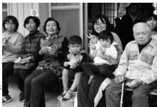
縁側で災害グッズの 蒸しパンを食べる様子