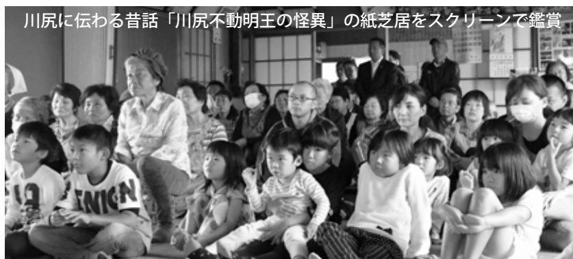
川尻に伝わる昔話「川尻不動明王の怪異」の紙芝居をスクリーンで鑑賞