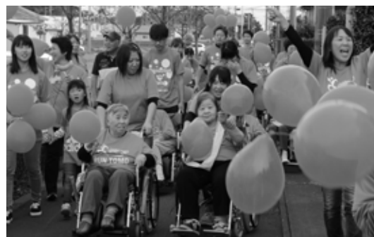
みんなでゴールを目指す様子

10月26日、RUN伴（ランとも）いばらき2019が菅谷地区を中心とした町内各地で開催され、笑顔で町中を歩く参加者の姿がありました。これは認知症の人と接点がなかった地域住民と、認知症の人や家族、医療福祉関係者が一緒にタスキをつなぎ、認知症への理解を促すイベントで、全国で行われています。