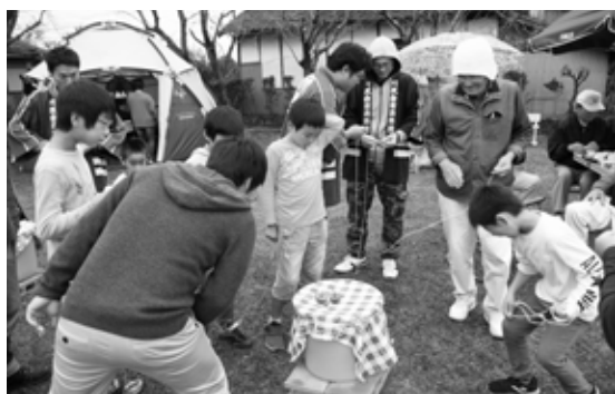
地域住民同士で ベーゴマで遊ぶ様子

私は今年で96歳になります。川尻行政区の住民だけでこのような行事を催すのは、本当に大変だったと思います。4月から約半年かけて準備協力してくれた皆さんに感謝です。改めて、お互いの顔が見られることがとても幸せなことだと感じました。また、今日をきっかけに新しい交流も生まれたようでもよかった。子どもと地域の大人たちが顔見知りの関係になれば防犯対策にもなるし、日常でも声をかけやすくなりますね。地域で子どもを育てるとは今回のようなこと積み重ねなんですよ。