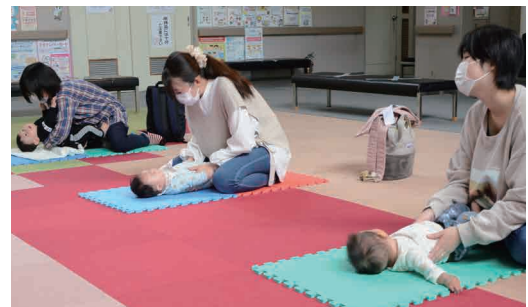
ベビーマッサージをする親子

11月18日、保健センターで子育てサポーターによるベビーマッサージ教室が開催されました。当日は事前に申し込みをした3組の親子が参加。子育てサポーターの指導を受けながら、足裏や背中などをマッサージすると、お子さんたちは笑顔を見せました。