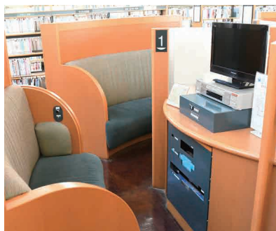
懐かしのビデオの他、CD・DVD のレンタルや視聴もできます！