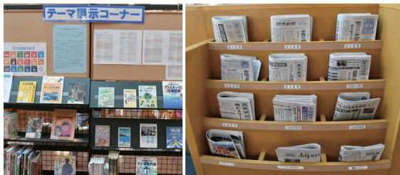
最新の各種新聞や雑誌 も取り揃えています！