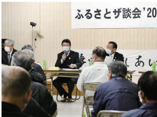
意見交換をする参加者

11月9日〜13日にかけて、町内5地区で、町長と今後のまちづくりについて共に考える「ふるさとザ談会」が開催されました。今回は、新型コロナウイルス感染症対策として、町議会議員と行政区長・副区長のみを対象として実施。意見交換では、少子高齢化対策や、憩遊館を核とした拠点づくり、空き家の有効活用など、まちづくりについての様々な意見が出されました。いただいたご意見を参考に、町民の皆さまにもご協力いただきながら「少子・高齢時代をしなやかに生きぬくまちづくり」の実現に向けて、取り組んでいきます。