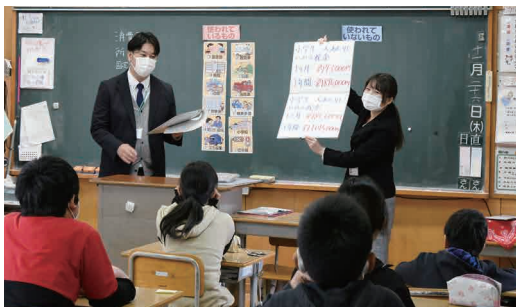
税金について学ぶ児童

税金の役割と納税義務への理解を深めるため、中結城小学校と東中学校で租税教室を開催しました。11月26日には中結城小学校6年生45人に向けてクラスごとに教室を実施。参加した児童から様々な質問が飛び交い、熱心に学ぶ姿がありました。