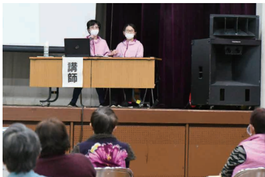
講演を聞く参加者

11月18日、中央公民館で認知症講演会が開催されました。始めに、特別養護老人ホームフィオーレの職員が、今年度から委託されている認知症カフェ「カフェフィオーレ」の活動報告を実施。その後、介護をテーマに制作された映画「ケアニン〜ここに咲く花〜」を上映し、参加者は、いつか訪れる介護について学び、思いを巡らせました。