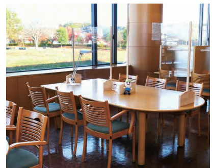
美しい景色を見ながら、 優雅な時間が過ごせます♪