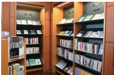
新着図書コーナーもあります！

電話：0296-48-4646 図書所蔵数（本）：約16万冊 視聴覚資料数（CD・DVD等）：約8,500点 パソコン室でインターネット検索もできます。