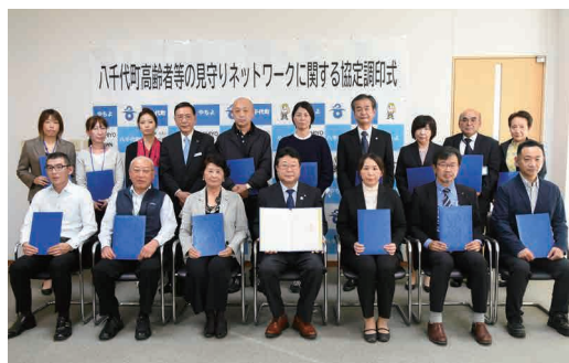
野村町長（中央）と協定を締結した事業所の皆さん

11月19日、役場庁議室で町高齢者等見守りネットワークに関する協定の締結式が行われ、町内の介護福祉事業所15社が新たに加わりました。これは町内の業務中に、高齢者等の要支援者の不審な行動を発見した際に、長寿支援課や警察署まで通報、または行方不明者が発生した際の情報提供等の協力体制を構築するためのものです。