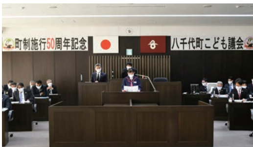
登壇して質問をする中学生

11月6日、町制施行50周年記念事業の一環として「こども議会」が開催されました。町内中学校から選出された18人の生徒が議長や議員となつて議案を進行し、町のPR方法の提案や環境問題に対する取り組みなど、中学生ならではの視点を活かした町への質問を登壇して行いました。