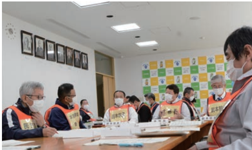
災害対策本部設置訓練の様子

11月26日、町職員を対象とした災害対応訓練を実施しました。今回は町内で最大震度6弱の揺れを観測したと想定。町内12ヶ所の避難所を含めた参集訓練と災害対策本部設置の図上訓練を行い、災害発生から災害対策本部設置・運営までの流れを確認して、問題点や改善点を洗い出しました。