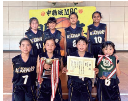
低学年の部で優勝した中結城MBCの皆さん