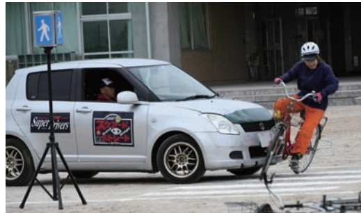
車と自転車の衝突を再現するスタントマン

11月18日、東中学校で「スケアード・ストリート教育技法」による交通安全教室が開催されました。これはスタントマンによる交通事故の再現を間近で目にすることで、生徒たちが交通安全に対する当事者意識を高めることを目的としています。生徒たちは迫力ある再現を真剣に見つめていました。