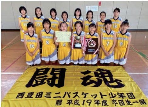
高学年の部で優勝した西豊田MBCの皆さん