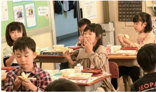
台湾バナナを食べる安静小学校の児童

11月5日、町内小中学校の給食に台湾バナナと台湾の料理「魯肉飯（ルーローハン）」が登場しました。これは笠間市と台湾が締結している覚書による「台湾バナナを自治体で共同輸入して学校給食に提供しよう」という取り組みに、町が参加して企画したもので、食を通じて異文化交流を目的としています。