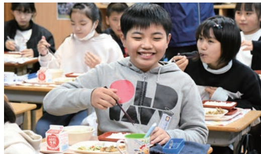
豚丼をたべる中結城小学校の児童たち

11月22日、町内小中学校の給食に茨城県の銘柄豚「ローズポーク」を使った豚丼が登場しました。常総地域農業振興協議会とJ A常総ひかりが地産地消のメリットや大切さを知ってもらおうとローズポークを無償提供。児童たちはクイズなどの理解を深めました。