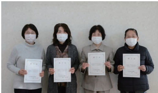
養成講座を修了した皆さん

11月30日、町家庭教育推進協議会が地域子育て支援事業で活躍する子育て支援ボランティアを育成するため、子育てサポーター養成講座を実施しました。4人の受講生は、ボランティアとして心構えやサポーターとしての子どもへの接し方、乳幼児の食育等について学び、修了証が交付されました。