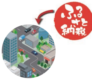
ふるさと納税を有効活用します

ふるさと納税による寄付金を基金として積み立て、寄付者が希望する事業の財源に充てるため、条例を制定するものです。