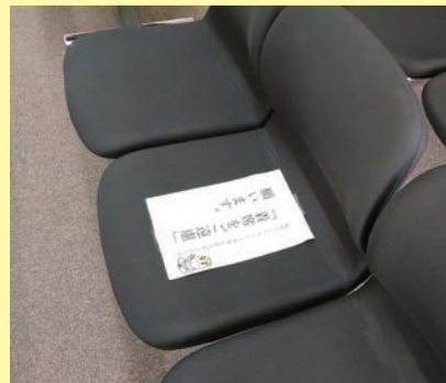
傍聴席では間隔の確保にご協力をお願いします