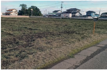
売却される町有地(菅谷地内)

雇用の場の確保、地場産業活性化のため、工業用地として菅谷地内の町有地(6839㎡)を株式会社ピククルスコーポレーションに3145万9400円で売却するものです。