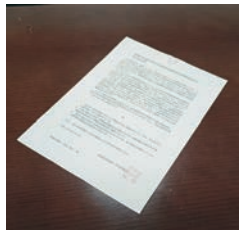
国に対し意見書を提出しました

・衆議院議長 ・参議院議長 ・内閣総理大臣 ・財務大臣 ・総務大臣 ・文部科学大臣