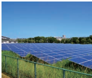
太陽光発電設備の適正な管理を

太陽光発電設備設置による災害発生の未然防止、生活環境の保全等に配慮した適正な管理のため、条例を制定するものです。