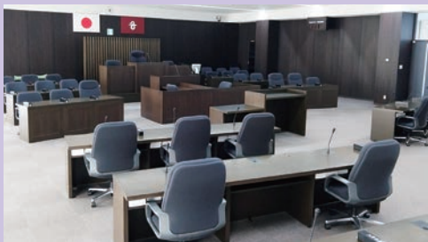
議場は役場4階にあります