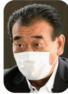
水垣 正弘 議員

マイナンバーカードは、顔写真付きの身分証明書として利用できるほか、住民票や印鑑証明書などのコンビニ交付、健康保険証としての利用ができ、今後、運転免許証との一体化が計画されているところだ。