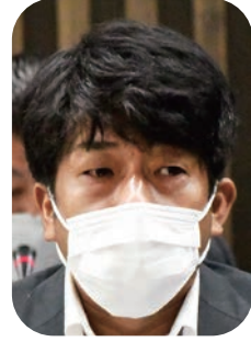
関 眞幸 議員

子どもたちが健やかに育つ上で、心の教育は大変重要です。学校生活における心の教育というと道徳の授業が思い浮かびますが、現在では道徳の授業は特別の教科という位置付けになっています。そのほかにも、ホームルームや休み時間、給食の時間など、学校生活にはさまざまな場面があります。それらにおける心の教育はどのようなものであるかをお聞きます。