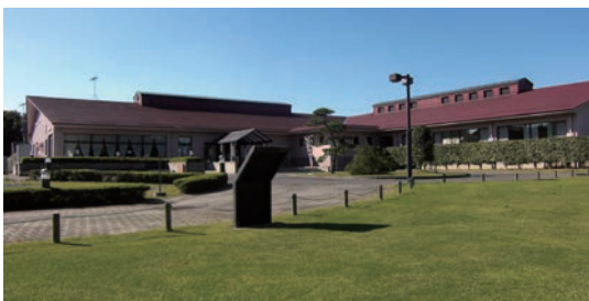
八千代グリーンビレッジ内の温泉施設・憩遊館

八千代グリーンビレッジ内の農産物加工センターを指定管理者の運営施設とするとともに、温泉施設を期間利用券でも利用できるようにするものです。