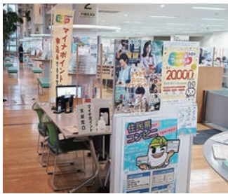
役場内のマイナポイント申請窓口

保健福祉部長 令和4年8月末時点で、要介護3が127名、要介護4が133名、要介護5が77名、合計337名となっています。町内には特別養護老人ホームが2カ所あり、定員の合計は120床と和4年7月末時点で65名です。地域密着型特別養護老人ホームの導入については、令