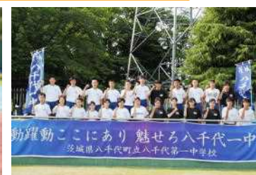
参加選手集合写真

6月7日(水)、県西総体陸上競技大会が、古河市イーエス中央運動公園陸上競技場において開催され、本校からは陸上部24名が参加しました。結果は7名が8位入賞、また4名が県標準記録を突破し、県大会への出場を決めました。県大会での更なる陸上部の活躍を期待しています。