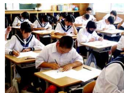
1年生英語科テストの様子

6月13日(火)に技能4教科、21日(水)に5教科の1学期末テストを実施しました。1年生にとっては中学校で初めての定期テストとなりました。取り組むべき教科の数も多く、テスト範囲も4月からの学習範囲と広いため、ワークシートや学習ノートの振り返りなど一生懸命取り組んでいました。テスト前の休部期間には、たくさんの生徒が質問に來たり、友達同士で問題を出し合う姿が多く見られました。