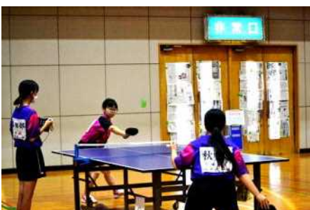
女子卓球 個人戦のみ