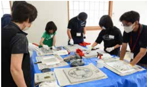
拓本を作る参加者

7月15日、中央公民館で子ども教室と高校生歴史学芸員講座を合同で実施し、拓本作りを行いました。拓本とは、墨と紙を使って石碑などに刻まれた銘や文字を凹凸を利用して写し取る技法です。当日は8人が参加し、八千代町で出土した土器のかげらなどで拓本を作りました。