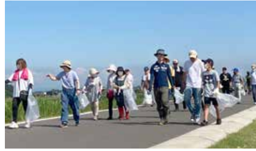
クリーン作戦の様子

7月2日、鬼怒川流域の行政区の協力のもと、第33回鬼怒川クリーン大作戦を実施しました。これは7月が河川愛護月間であることにちなみ、鬼怒川・小貝川流域ネットワーク会議が主催したものです。当日は約600人が参加し、行政区ごとに清掃活動を行いました。