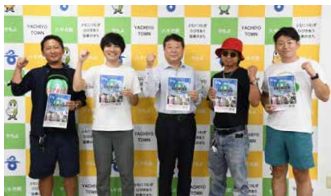
「やちおん」企画運営の中心メンバーの皆さん

今はまだ公表できませんが、若者のパワーをもらい、私の胸に秘めた夢の一つを行動に移す時が来たように思います。