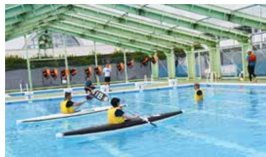
カヌー体験教室の様子

7月15日、海洋センターで海洋クラブ主催の大人のカヌー体験教室（入門編）を実施しました。パドルの操作方法やカヌーへの乗り方などを学んだ後、プール内で実際にカヌーを操作した参加者たちは「思っていたより難しい」「川などでやる前にプールで体験できてよかった」と話していました。