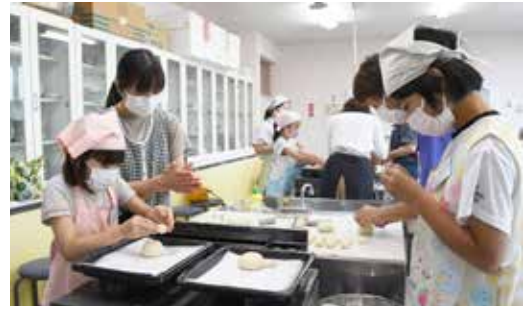
パンを成型する参加者

7月15日、公民館親子ふれあい教室で親子手作りパン教室を実施しました。当日は8組の親子が参加し、グローブ型のカレーパン作りに挑戦。生地をこねて発酵させ、具材を包んで成型して焼き上げるまでを体験しました。参加者たちは「美味しそうにできた」と笑顔で話していました。