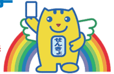
明るい選挙キャラクター 選挙のめいすいくん