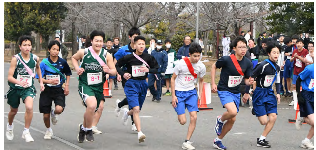
スタート時の様子