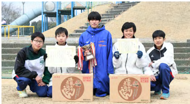
優勝した八千代一中陸上部の皆さん

中学男子の部 優勝 八千代一中陸上部 (44分6秒) 準優勝 八千代東中選抜 (47分28秒) 第3位 デコピンズ (50分3秒)