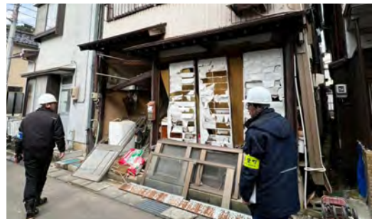
能登町での活動の様子

1月16日、県の要請に基づき、町職員2人が茨城県派遣チームの一員として能登半島地震の被災地支援に出発しました。派遣期間は5日間で、派遣先の能登町では、罹災証明発行支援等を主に行いました。今後も要請に基づき職員を派遣し、被災地支援を行っていきます。