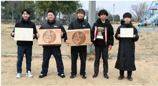
優勝したチーム宮田Aの皆さん

一般の部 優勝 チーム宮田A (45分48秒) 準優勝 チーム宮田B (51分7秒) 第3位 八千代町役場 plus+ (51分47秒)