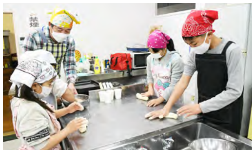
ピザ生地をこねる参加者たち

1月21日、町内の小学生を対象とした子ども教室で「ピザ作り体験教室」を実施しました。当日は18人の児童が参加し、生地作りからピザを焼き上げるまでの作業に挑戦。生地をこねたり包丁で材料を切るなど、慣れない作業に苦戦しながらも、全員が手作りピザを完成させました。