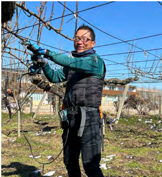
地域おこし協力隊員(果樹振興プロジェクト)