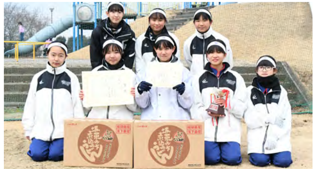
優勝した八千代一中陸上部の皆さん

中学女子の部 優勝 八千代一中陸上部 (53分12秒) 準優勝 ヌヌーピー (56分8秒) 第3位 Let's らんにんぐ (61分10秒)