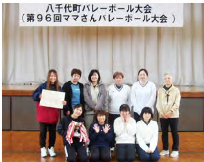
優勝した仁江戸チームの皆さん