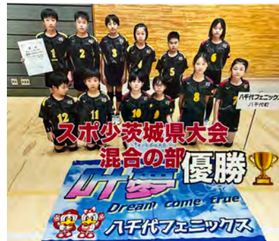
優勝した八千代フェニックスの皆さん