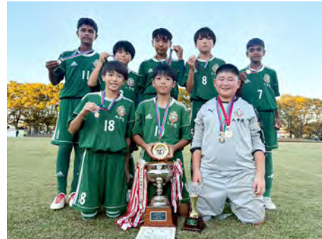
優勝した八千代SSの皆さん