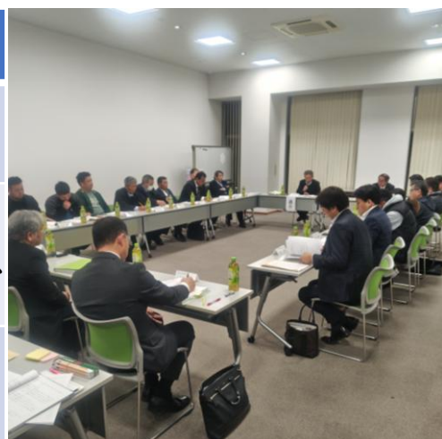
3月に行われた第3回統合準備委員会の様子