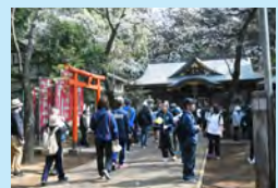
ウォーキングを楽しむ参加者