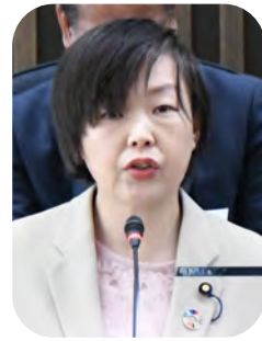
赤荻 妙子 議員

近年、リチウムイオン電池による火災が全国的に急増し、ニュースで報じられています。日常生活に急速に浸透した一方で、適切な取り扱いについては、認知、理解が進んでいないのが現状です。リ