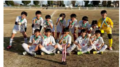
優勝した八千代SSの皆さん

〔と き〕 2月28日(土)、 3月1日(日) 〔と ころ〕 結城市鹿窪サッカー場 〔主 催〕 結城市サッカー協会 〔主な結果〕 優勝 八千代SS