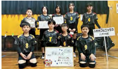
優勝した八千代フェニックスの皆さん

〔と き〕 2月22日(日) 〔と ころ〕 三妻小学校 〔主 催〕 常総市社会人バレーボール協会 〔主な結果〕 優勝 八千代フェニックス