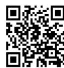
映像配信専用ページ

議会に傍聴に来ることができない方でも、議会開催日にはインターネットにより生中継をご覧いただけるほか、生中継終了後、おおむね5日後から録画映像をご覧いただけます。