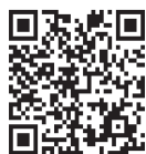
はら 画ち 動こ

産業建設部長 下妻市と連携し、毎年県へ要望活動を実施しています。今後、早期事業化を目指し、県へ強く要望していきます。