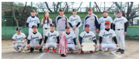
優勝した伊勢山ソフトクラブの皆さん