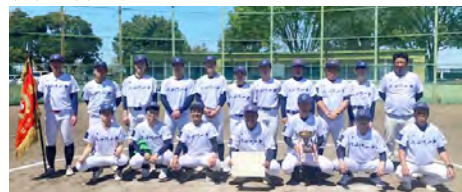
優勝した八千代一中OBの皆さん