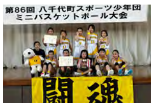
高学年の部で優勝した西豊田MBCの皆さん

〔主な結果〕 高学年の部 優勝 西豊田MBC 準優勝 八千代MBC 第3位 中結城MBC 敢闘賞 川西MBC 低学年の部 優勝 中結城MBC (A) 準優勝 中結城MBC (B) 第3位 八千代MBC・西豊田MBC (合同チーム)