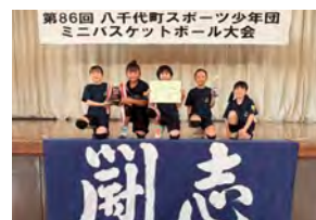
低学年の部で優勝した中結城MBC (A)の皆さん