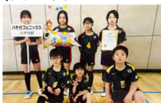
優勝した八千代フェニックスの皆さん