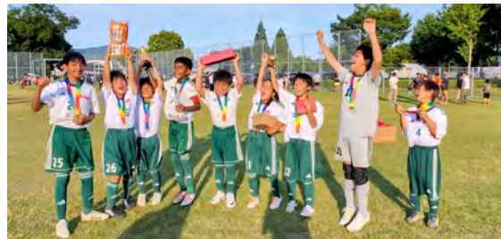
優勝した八千代SSの皆さん

〔と き〕 5月31日(日) 〔と ころ〕 つくばウェルネスパーク 〔主 催〕 FC REGISTA TSUKUBA、バンビーノ SC 〔主な結果〕 優 勝 八千代SS