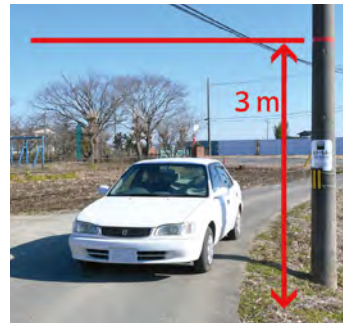
川西小学校 想定浸水深 (0.5m ~ 3m)