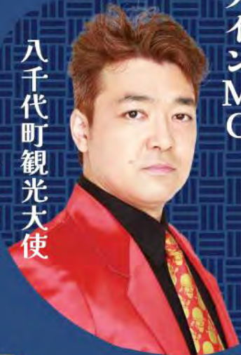
メインMC 八千代町観光大使 一番星

お子様が楽しめるイベントや お楽しみ抽選会、屋台、 キッチンカーなどいろいろあるよ！