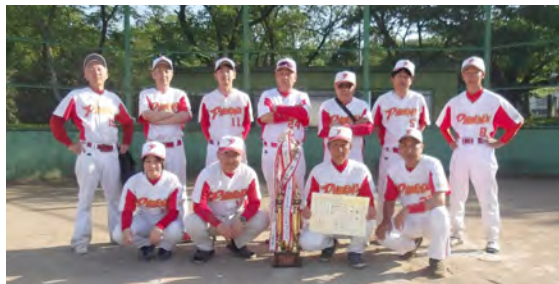
優勝したフェニックスの皆さん